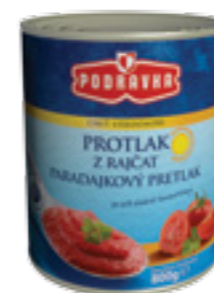
PODRAVKA RAJČATOVÝ KONCENTRÁT

Pro tento výrobek jsou použita ta nejvzrálější rajčata, která se zásadně konzervují vcelku. Loupaná rajčata se výborně hodí jako základ pod maso (zejména hovězí), na přípravu omelet nebo do ragů.