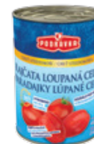
PODRAVKA LOUPANÁ RAJČATA CELÁ

Hmotnost: 2150 g Kód zboží: J830CZ EAN kód: 3850104278303 Ks/ karton: 6 Karton/ paleta: 50 Minimální trvanlivost: 36 měsíců