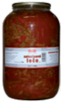
PODRAVKA ZELENINOVÉ LEČO

Hmotnost: 3,5 kg / 1,75 kg Kód zboží: C757CZ EAN kód: 8594004494313 Ks/ karton: 3 Karton/ paleta: 44+8 Minimální trvanlivost: 48 měsíců