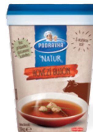
PODRAVKA NATUR HOVĚZÍ BUJÓN

Hmotnost: 1 kg Kód zboží: G999CQ EAN kód: 3850104259999 Ks/ karton: 6 Karton/ paleta: 45 Počet porcí: 180/ 0,25 l Minimální trvanlivost: 15 měsíců