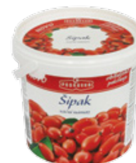
PODRAVKA ŠÍPKOVÁ POMAZÁNKA

Hmotnost: 1 kg Kód zboží: A029256 EAN kód: 3850104259418 Ks/ karton: 6 Karton/ paleta: 63