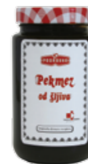
PODRAVKA ŠVESTKOVÁ POVIDLA

Hmotnost: 850 g Kód zboží: A025669 EAN kód: 3856020214210 Ks/ karton: 8 Karton/ paleta: 72