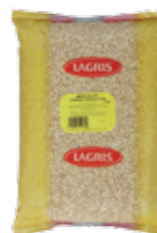
LAGRIS HRÁCH ŽLUTÝ LOUPANÝ PŮLENÝ

Hmotnost: 5 kg Kód zboží: C129CZ EAN kód: 8594004490612 Ks/ karton: 1 Karton/ paleta: 120 Počet porcí: 45/ 300 g Minimální trvanlivost: 18 měsíců