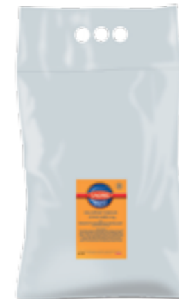
LAGRIS CELOZRNNÝ KNEDLÍK

Krutony jsou jemně slané křupavé kostičky pečiva orestovaného dozlatova. Jsou vhodné do krémových polévek ze zeleniny, ale jsou výborné v lehkých salátech se zeleninou nebo masem.