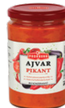
PODRAVKA AJVAR OSTRÝ

Hmotnost: 690 g Kód zboží: 5057CQ EAN kód: 3850104050572 Ks/ karton: 12 Karton/ paleta: 64