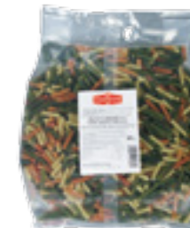
PODRAVKA VŘETENA TŘÍBAREVNÁ

Hmotnost: 5 kg Kód zboží: C624CZ EAN kód: 8594004494009 Ks/ karton: 1 Karton/ paleta: 60 Počet porcí: 63/ 200 g Minimální trvanlivost: 36 měsíců