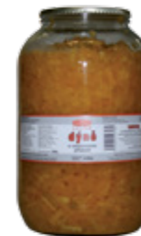
PODRAVKA DÝŇ S ANANASOVOU PŘÍCHUTÍ

Hmotnost: 3,5 kg / 1,75 kg Kód zboží: C798CZ EAN kód: 8594004493484 Ks/ karton: 3 Karton/ paleta: 44+8