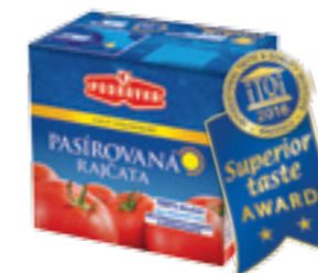
PODRAVKA RAJČATA PASÍROVANÁ

Hmotnost: 2490 g Kód zboží: 0190CZ EAN kód: 3850104073717 Ks/ karton: 6 Karton/ paleta: 40 Minimální trvanlivost: 36 měsíců