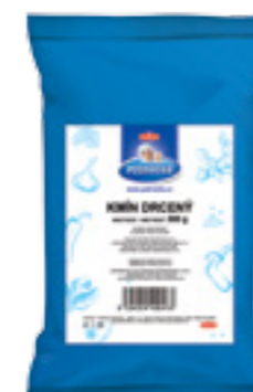
PODRAVKA KMÍN DRCENÝ