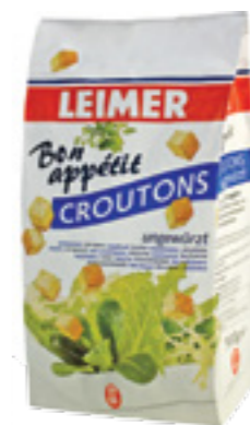
LEIMER KRUTONY BEZPŘÍCHUOVÉ

Hmotnost: 1 kg Kód zboží: C995CZ EAN kód: 4000186032501 Ks/ karton: 4 Karton/ paleta: 36 Minimální trvanlivost: 6 měsíců