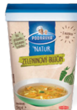
PODRAVKA NATUR ZELENINOVÝ BUJÓN

Hmotnost: 1 kg Kód zboží: H002CQ EAN kód: 3850104260025 Ks/ karton: 6 Karton/ paleta: 45 Počet porcí: 180/ 0,25 l Minimální trvanlivost: 15 měsíců