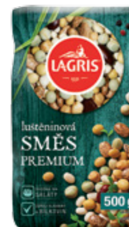
LAGRIS LUŠTĚNINOVÁ SMĚS PREMIUM

Hmotnost: 500 g Kód zboží: CA43CZ EAN kód: 8594004497000 Ks/ karton: 6 Karton/ paleta: 240