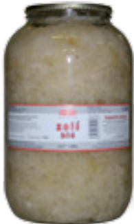
PODRAVKA ZELÍ BÍLÉ

Sterilovaná jednodruhová či vícedruhová zelenina v kuchyni šetří čas potřebný k přípravě jídel a obohacuje jídelníček o ty druhy, které mimo sezónu nejsou běžně k dostání. Dá se použít jako surovina při přípravě teplých i studených pokrmů, jako studená příloha nebo jako klasická teplá zelenina k hotovému jídlu. Sterilovaná zelenina je při zachování svojí původní chuti často zvýrazněna pikantnějšími variacemi nálevu.