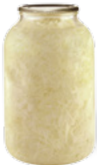
PODRAVKA ZELÍ BÍLÉ STANDARD

Hmotnost: 3,5 kg / 1,75 kg Kód zboží: C581CZ EAN kód: 8594004494436 Ks/ karton: 3 Karton/ paleta: 44+8 Minimální trvanlivost: 48 měsíců