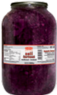
PODRAVKA ZELÍ ČERVENÉ

Hmotnost: 3,3 kg / 1,7 kg Kód zboží: C605CZ EAN kód: 8594004493170 Ks/ karton: 3 Karton/ paleta: 44+8 Minimální trvanlivost: 48 měsíců