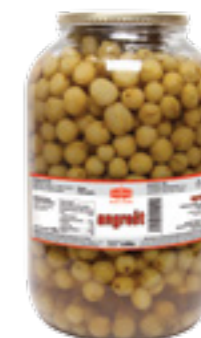
PODRAVKA KOMPOTOVANÝ ANGREŠT

Hmotnost: 3,5 kg / 1,8 kg Kód zboží: CB42CZ EAN kód: 8595686700815 Ks/ karton: 3 Karton/ paleta: 44+8