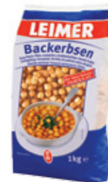
LEIMER HRÁŠEK SMAŽENÝ

Hmotnost: 5 kg Kód zboží: C973CZ EAN kód: 8594004498427 Ks/ karton: 1 Karton/ paleta: 120 Počet porcí: 55/ 160 g Minimální trvanlivost: 12 měsíců