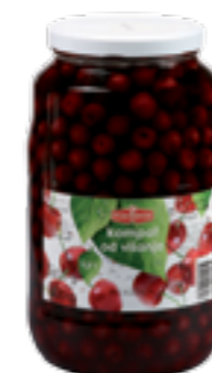
PODRAVKA VIŠŇ BEZ PECEK

Hmotnost: 3,6 kg / 1,3 kg Kód zboží: A027441 EAN kód: 3850104229817 Ks/ karton: 6 Karton/ paleta: 32