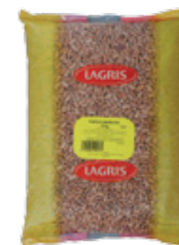
LAGRIS FAZOLE BAREVNÁ

Hmotnost: 5 kg Kód zboží: C123CZ EAN kód: 8594004492265 Ks/ karton: 1 Karton/ paleta: 60 Počet porcí: 45/ 300 g Minimální trvanlivost: 18 měsíců