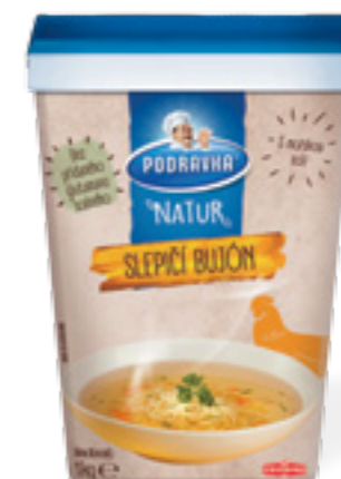
PODRAVKA NATUR SLEPIČÍ BUJÓN

Hmotnost: 1 kg Kód zboží: G999CQ EAN kód: 3850104259999 Ks/ karton: 6 Karton/ paleta: 45 Počet porcí: 180/ 0,25 l Minimální trvanlivost: 15 měsíců