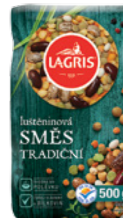
LAGRIS LUŠTĚNINOVÁ SMĚS TRADIČNÍ

Hmotnost: 500 g Kód zboží: CA44CZ EAN kód: 8594004497116 Ks/ karton: 6 Karton/ paleta: 240