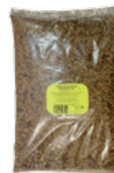
LAGRIS ČOČKA ZELENÁ VELKOZRNÁ STANDARD

Hmotnost: 5 kg Kód zboží: C097CZ EAN kód: 8594004490513 Ks/ karton: 1 Karton/ paleta: 120 Počet porcí: 45/ 300 g Minimální trvanlivost: 18 měsíců