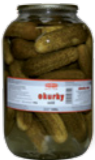
PODRAVKA OKURKY 6 - 9 cm

Hmotnost: 3,5 kg / 1,85 kg Kód zboží: A901555 EAN kód: 8595686700785 Ks/ karton: 3 Karton/ paleta: 44+8 Minimální trvanlivost: 48 měsíců