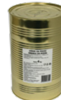
PODRAVKA RAJČATA PASÍROVANÁ OCHUCENÁ

Hmotnost: 950 g Kód zboží: A032081 EAN kód: 3856020226619 Ks/ karton: 6 Karton/ paleta: 60 Minimální trvanlivost: 36 měsíců