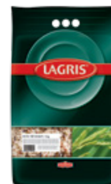
LAGRIS RÝŽE TŘÍ BAREV

Hmotnost: 3 kg Kód zboží: C654CZ EAN kód: 8594004492807 Ks/ karton: 1 Karton/ paleta: 216 Počet porcí: 85/ 200 g