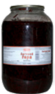
PODRAVKA ČERVENÁ ŘEPA VLASOVÝ ŘEZ

Hmotnost: 3,3 kg / 1,95 kg Kód zboží: C584CZ EAN kód: 8594004493422 Ks/ karton: 3 Karton/ paleta: 44+8 Minimální trvanlivost: 48 měsíců