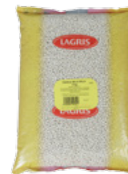
LAGRIS FAZOLE BÍLÁ MALÁ

BAREVNÉ FAZOLE dozrávají v červené, hnědé i černé barvě. Při úpravě jim nevadí ostřejší koření, a proto se používají zejména v mexické kuchyni. Ideální jsou například pro přípravu Chilli con carne.