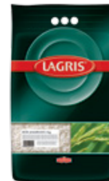
LAGRIS RÝŽE JASMÍNOVÁ

Hmotnost: 5 kg Kód zboží: C006CZ EAN kód: 8594004491312 Ks/ karton: 1 Karton/ paleta: 120 Počet porcí: 71/ 200 g