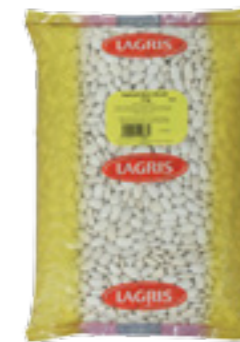
LAGRIS FAZOLE BÍLÁ VELKÁ

Hmotnost: 5 kg Kód zboží: C106CZ EAN kód: 8594004490551 Ks/ karton: 1 Karton/ paleta: 120 Počet porcí: 45/ 300 g Minimální trvanlivost: 18 měsíců