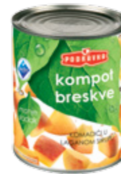
PODRAVKA BROSKVOVÝ KOMPOT

Všechny kompoty naleznete v kuchyni široké možnosti použití - od prostých kompotů, přes sladká jídla, dezerty až po poháry.