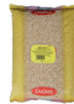
LAGRIS HRÁCH ŽLUTÝ LOUPANÝ CELÝ

Hmotnost: 5 kg Kód zboží: C136CZ EAN kód: 8594004490599 Ks/ karton: 1 Karton/ paleta: 120 Počet porcí: 45/ 300 g Minimální trvanlivost: 18 měsíců