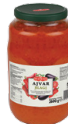
PODRAVKA AJVAR JEMNÝ

Hmotnost: 2,6 kg Kód zboží: D988HR EAN kód: 3850104229886 Ks/ karton: 4 Karton/ paleta: 48