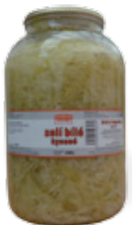
PODRAVKA ZELÍ KYŠANÉ BÍLÉ

Hmotnost: 3,3 kg / 1,7 kg Kód zboží: A900169 EAN kód: 8594004491244 Ks/ karton: 1 Karton/ paleta: 140 Minimální trvanlivost: 36 měsíců