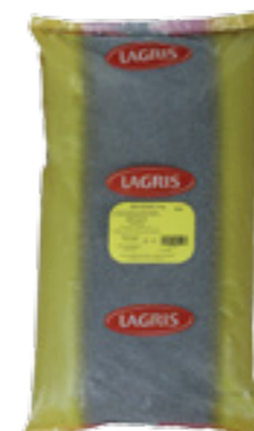
LAGRIS MÁK MODRÝ CELÝ

Hmotnost: 5 kg Kód zboží: C158CZ EAN kód: 8594004490377 Ks/ karton: 1 Karton/ paleta: 120