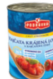
PODRAVKA RAJČATA KRÁJENÁ LOUPANÁ

Hmotnost: 500 g Kód zboží: H217CQ EAN kód: 3850104073656 Ks/ karton: 12 Karton/ paleta: 108 Minimální trvanlivost: 36 měsíců