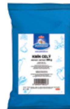
PODRAVKA KMÍN CELÝ