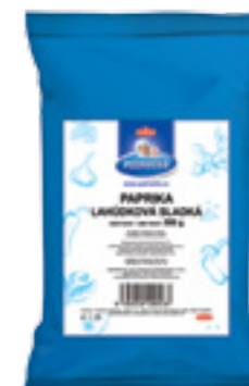
PODRAVKA PAPRIKA LAHŮDKOVÁ SLADKÁ

Kmín je jedno z nejstarších koření používaných v Evropě. Nejčastěji jej používáme k ochucení chleba, brambor, omáček, salátů, při dušení hřibů, vaření zelí atd., pro českou kuchyni je proto nepostradatelný. Příznivě působí na zažívání, pomáhá při nadýmání, je tedy vhodné jej používat při vaření luštěnin.