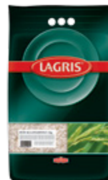
LAGRIS RÝŽE KULATOZRNÁ

Hmotnost: 5 kg Kód zboží: C041CZ EAN kód: 8594004490070 Ks/ karton: 1 Karton/ paleta: 120 Počet porcí: 71/ 200 g