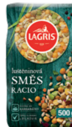
LAGRIS LUŠTĚNINOVÁ SMĚS RACIO

Ideální do luštěninových salátů, jako samostatná luštěninová příloha, do kaší, pomazánek, součást polévek. Obsahuje fazoli malou bílou, fazoli barevnou, soju, hrách zelený celý, cizrnu a fazoli červenou ledvinu.