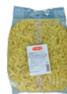
PODRAVKA ŠIROKÉ NUDLE VLNKY

Hmotnost: 5 kg Kód zboží: C622CZ EAN kód: 8594004494344 Ks/ karton: 1 Karton/ paleta: 60 Počet porcí: 63/ 200 g Minimální trvanlivost: 36 měsíců