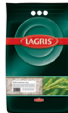
LAGRIS RÝŽE BASMATI

Tato rýže má malá, kulatá až baculatá zrnka. Říká se jí také mléčná rýže. Obsahuje totiž vysoký podíl škrobu, díky kterému skvěle absorbuje vodu a po uvaření je krásně měkká a nadýchaná. Díky svojí lepivé konzistenci se báječně hodí k přípravě rozmanitých nádivek a náplní, na španělskou paellu či rýžové placičky. Skvěle se uplatní i při přípravě nákypů, pudinků, rýžových kaší a dalších sladkých jídel. Podobně jako jiné typy rýží je přirozeně bez lepku a má nízký obsah cholesterolu.