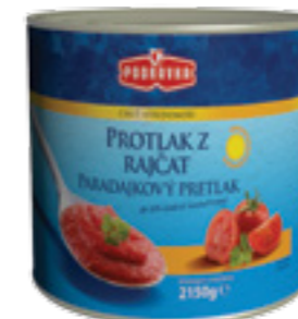
PODRAVKA RAJČATOVÝ KONCENTRÁT

Hmotnost: 800 g Kód zboží: J831CZ EAN kód: 3850104278310 Ks/ karton: 12 Karton/ paleta: 72 Minimální trvanlivost: 36 měsíců