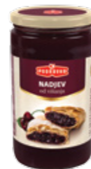
PODRAVKA TERMOSTABILNÍ VIŠŇOVÁ NÁPLŇ

Mák jako potravinu pěstují už od 9. století především slovanské národy. Významným celosvětovým producentem máku je Česká republika. Maková semena obsahují až 60 % oleje, bílkoviny a stopové prvky.