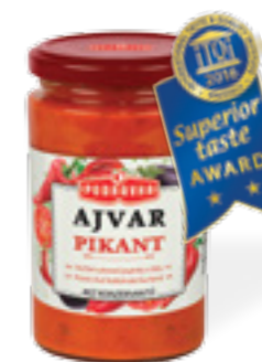
PODRAVKA AJVAR OSTRÝ

Hmotnost: 350 g Kód zboží: 5056CQ EAN kód: 3850104050565 Ks/ karton: 12 Karton/ paleta: 65