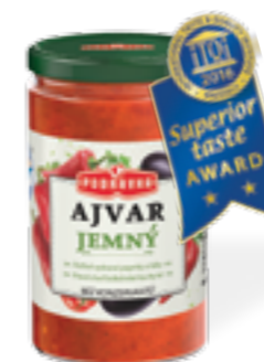
PODRAVKA AJVAR JEMNÝ

Podravka ve svém sortimentu nabízí celkem 2 druhy Ajvaru - jemný a ostrý.