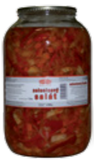
PODRAVKA ZELENINOVÝ SALÁT

Hmotnost: 3,4 kg / 1,7 kg Kód zboží: C935CZ EAN kód: 8594004495006 Ks/ karton: 3 Karton/ paleta: 44+8 Minimální trvanlivost: 48 měsíců