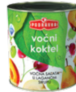
PODRAVKA OVOCNÝ KOKTEJL

Hmotnost: 2,6 kg / 1,5 kg Kód zboží: 6849CQ EAN kód: 3850104068492 Ks/ karton: 6 Karton/ paleta: 25