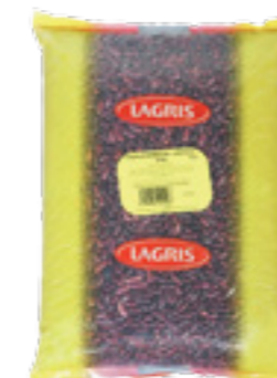
LAGRIS FAZOLE ČERVENÁ LEDVINA

Hmotnost: 5 kg Kód zboží: C003CZ EAN kód: 8594004490575 Ks/ karton: 1 Karton/ paleta: 120 Počet porcí: 45/ 300 g Minimální trvanlivost: 18 měsíců