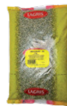
LAGRIS HRÁCH ZELENÝ CELÝ

Hmotnost: 5 kg Kód zboží: C725CZ EAN kód: 8594004493095 Ks/ karton: 1 Karton/ paleta: 120 Počet porcí: 45/ 300 g Minimální trvanlivost: 18 měsíců