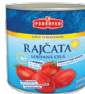
PODRAVKA LOUPANÁ RAJČATA CELÁ

Hmotnost: 400 g Kód zboží: 8794CZ EAN kód: 3850104073724 Ks/ karton: 12 Karton/ paleta: 144 Minimální trvanlivost: 36 měsíců