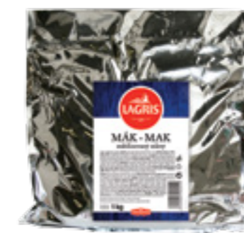
LAGRIS MÁK MLETÝ S CUKREM STABILIZOVANÝ

Hmotnost: 1 kg Kód zboží: C511CZ EAN kód: 8594004494412 Ks/ karton: 5 Karton/ paleta: 126