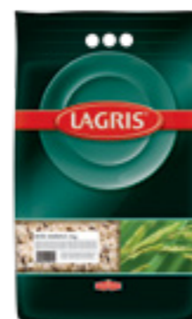
LAGRIS RÝŽE SMĚSNÁ

Hmotnost: 5 kg Kód zboží: C082CZ EAN kód: 8594004490162 Ks/ karton: 1 Karton/ paleta: 120 Počet porcí: 85/ 200 g