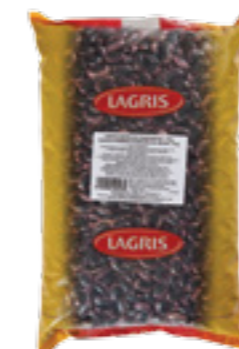
LAGRIS FAZOLE PURPUROVÁ VELKÁ

Hmotnost: 5 kg Kód zboží: C002CZ EAN kód: 8594004490681 Ks/ karton: 1 Karton/ paleta: 120 Počet porcí: 45/ 300 g Minimální trvanlivost: 18 měsíců