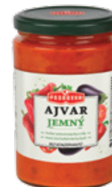
PODRAVKA AJVAR JEMNÝ

Hmotnost: 690 g Kód zboží: 5101CQ EAN kód: 3850104051012 Ks/ karton: 12 Karton/ paleta: 64