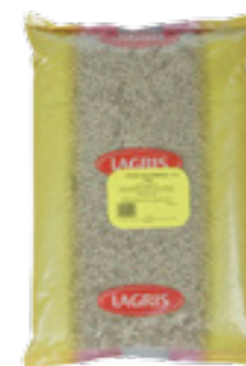
LAGRIS ČOČKA ZELENÁ VELKOZRNÁ

Loupaný hrách je surovina s vysokým obsahem bílkovin, je velmi dobrým zdrojem draslíku a vitamínu B. Komplex uhlohydrátů, který hrách obsahuje, uvolňuje energii postupně. Hrách je dobrým zdrojem folátu (kyselina listová) a vitamínu K1, který aktivuje osteokalcin potřebný pro zdravé kosti. Hrách je také velmi dobrou zásobárnou železa nutného pro tvorbu červených krvinek a vitamínu C chránícího před volnými radikály. Obecně je hrách vhodný pro všechny vyznavače zdravého životního stylu. Nezanedbatelný je také pro děti ve vývoji.