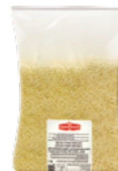
PODRAVKA TĚSTOVINOVÁ RÝŽE SEMOLINOVÁ

Hmotnost: 3 kg Kód zboží: C606CZ EAN kód: 8594004490728 Ks/ karton: 1 Karton/ paleta: 100 Počet porcí: 176/ 40 g Minimální trvanlivost: 36 měsíců