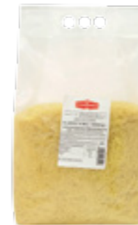
PODRAVKA VLASOVÉ NUDLE

Tarhoňa je tradiční přílohou zejména pro oblast Slovenska a východní Moravy. Tarhoňa od Podravky je stejně jako ostatní druhy vyrobena ze 100% semoliny a díky tomu vznikl unikátní výrobek, který v sobě snoubí tradici s vysokou kvalitou a vlastnostmi semolinové mouky.